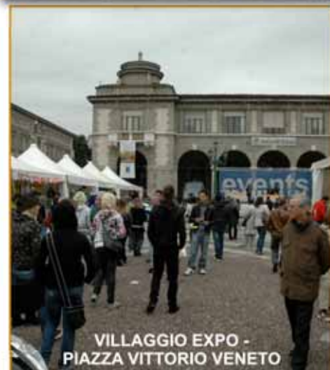
VILLAGGIO EXPO - PIAZZA VITTORIO VENETO