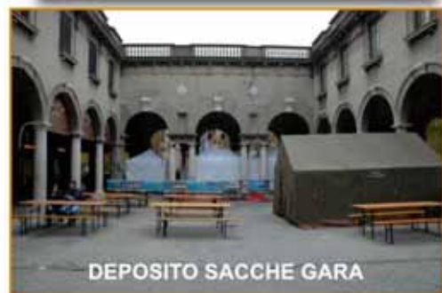
DEPOSITO SACCHE GARA